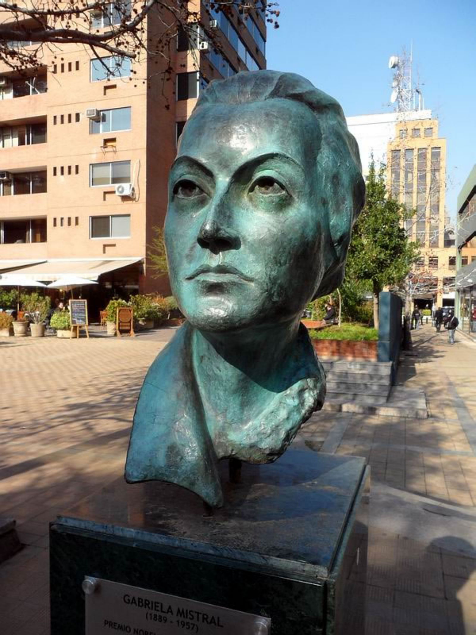
GABRIELA MISTRAL (1889 - 1957) PREMIO NOBEL