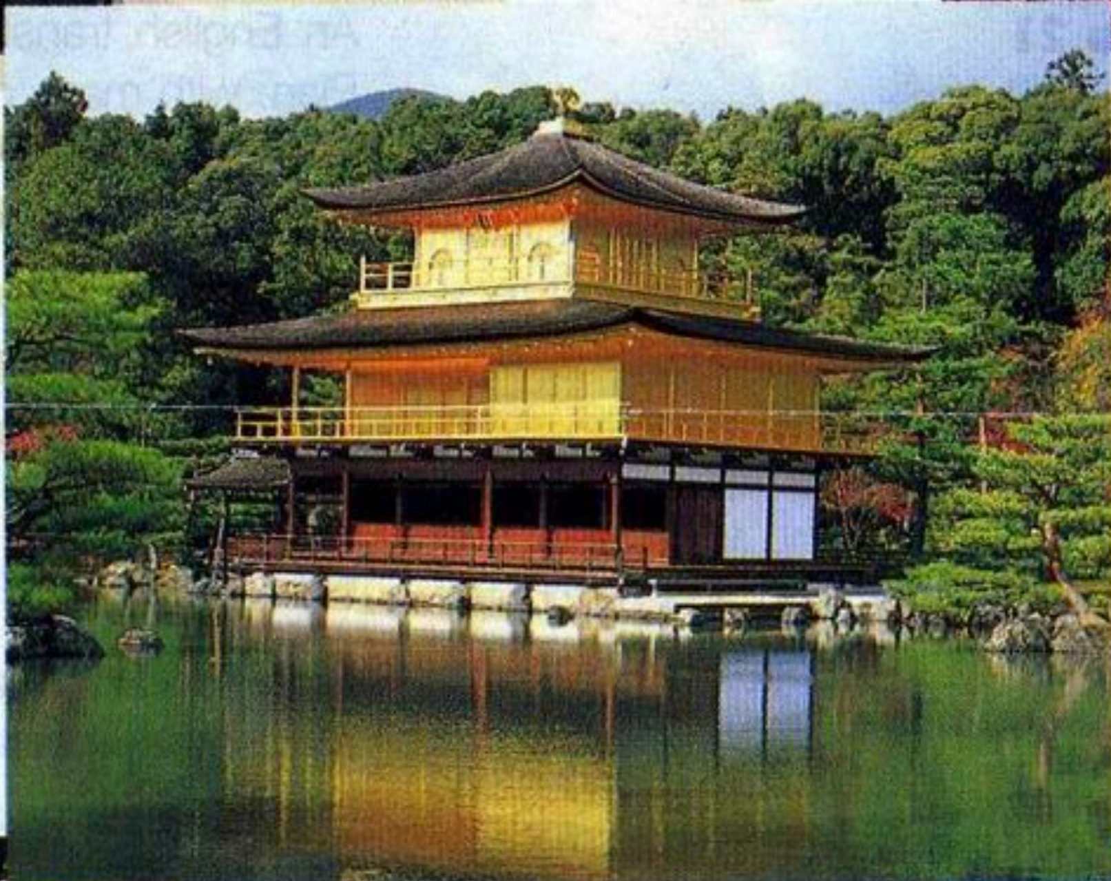
Golden Pavilion world cultural heritage