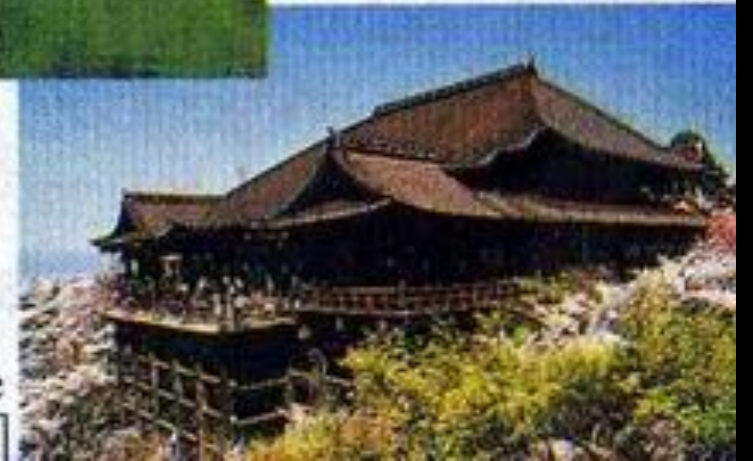
Kiyomizu Temple world cultural heritage